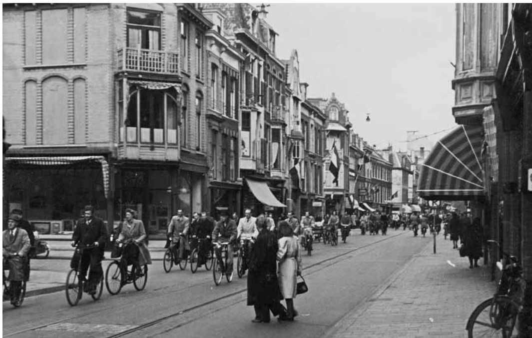
6. De Piet Heinstraat, bij de kruising met de Van Galenstraat en gezien naar het Piet Heinplein. Links voor, op de hoek de winkel op nr. 113. Het pand op nr. 117-119, op de tegenoverliggende hoek, valt net buiten beeld.