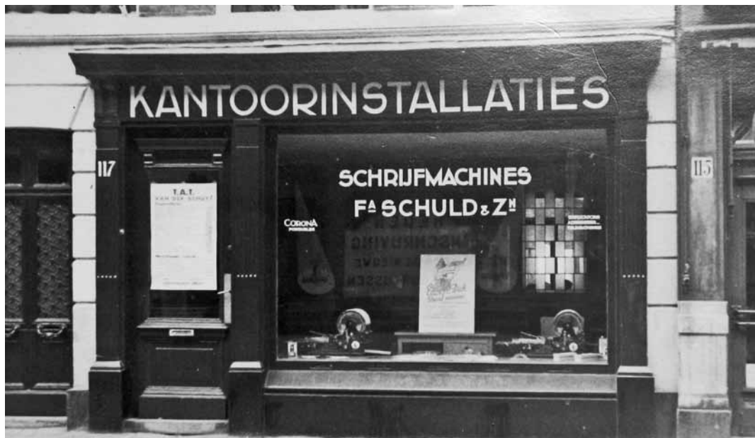
4. De schrijfmachinewinkel van de firma Schuld, die van 1940 tot 1975 gevestigd was op Piet Heinstraat 117.