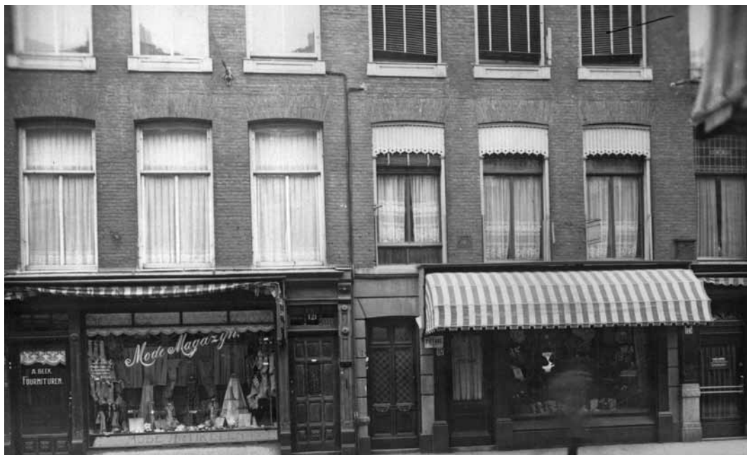
1. Rechts het huis Piet Heinstraat 117-119 met beneden (op nr. 117) de herenmodezaak Old England. Links op nr. 123 Mode Magazijn A. Beek Fournituren, 1928.

woners van Den Haag en bekende namen uit de 'toonaangevende kringen' elkaar tegenkomen.